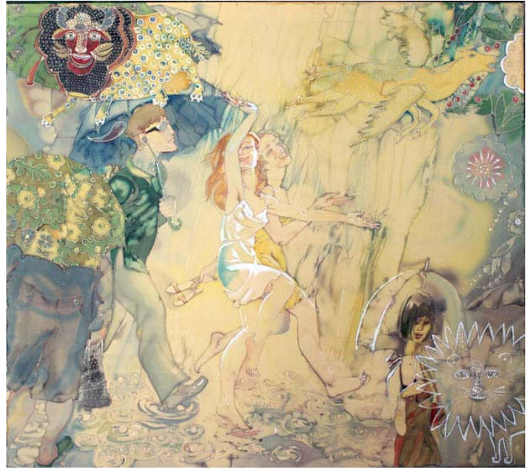
«Дошик. дошик». 80x80. батик. 2007