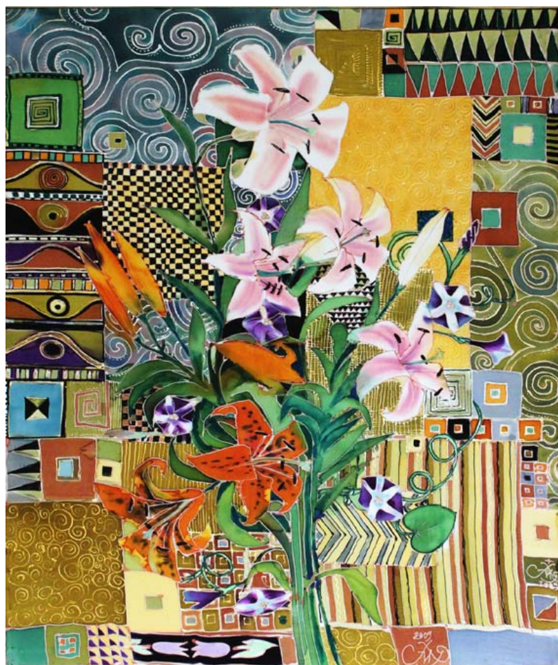
«Модерн», 79х64, шовк, батик, 2003