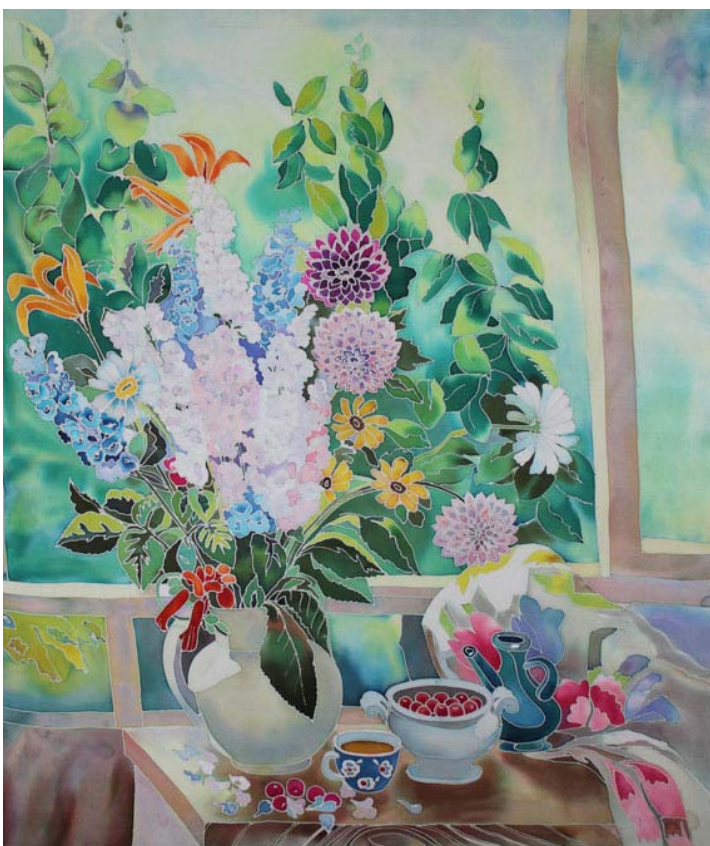
«Ранкова свіжість», 105x95, шовк, батик, 2001