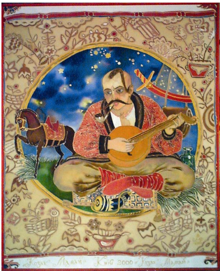
«Козак Мамай», 105x85, шовк, батик, 2000