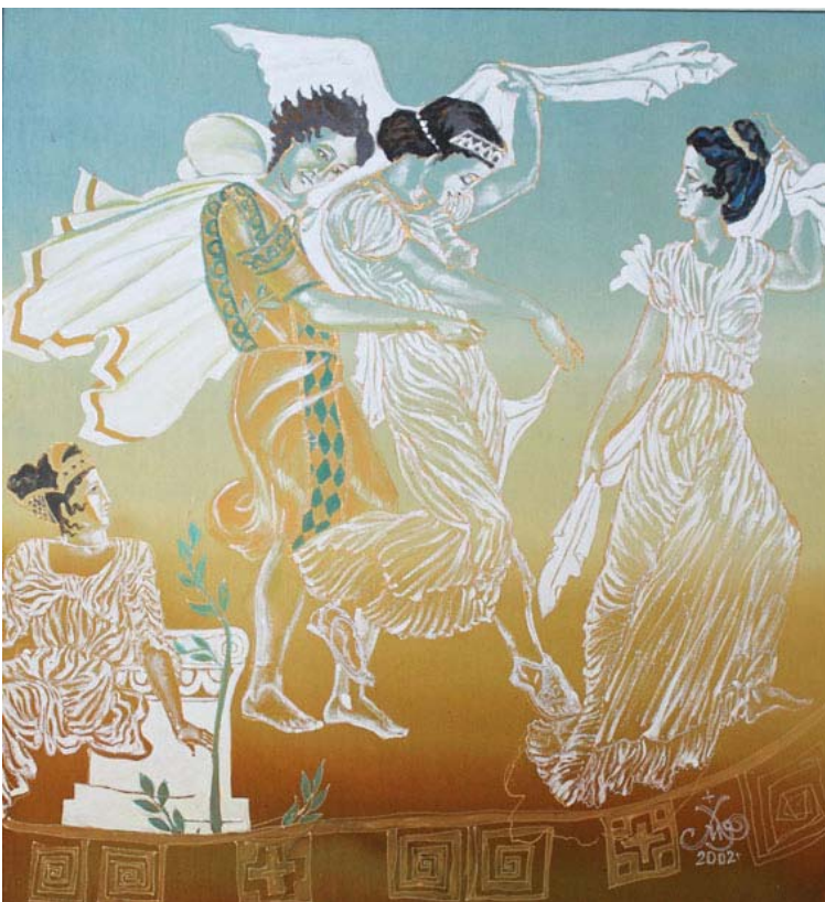
«Ритми сиртаки», 74x67, бавовна, батик, 2002