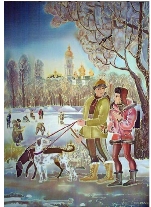
«Русанівська набережна», 120x90, шовк, батик, 2001