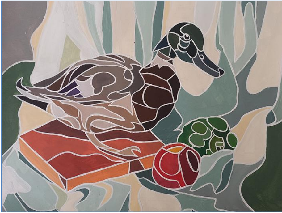
Приклад, виконаного завдання з декоративної стилізації.