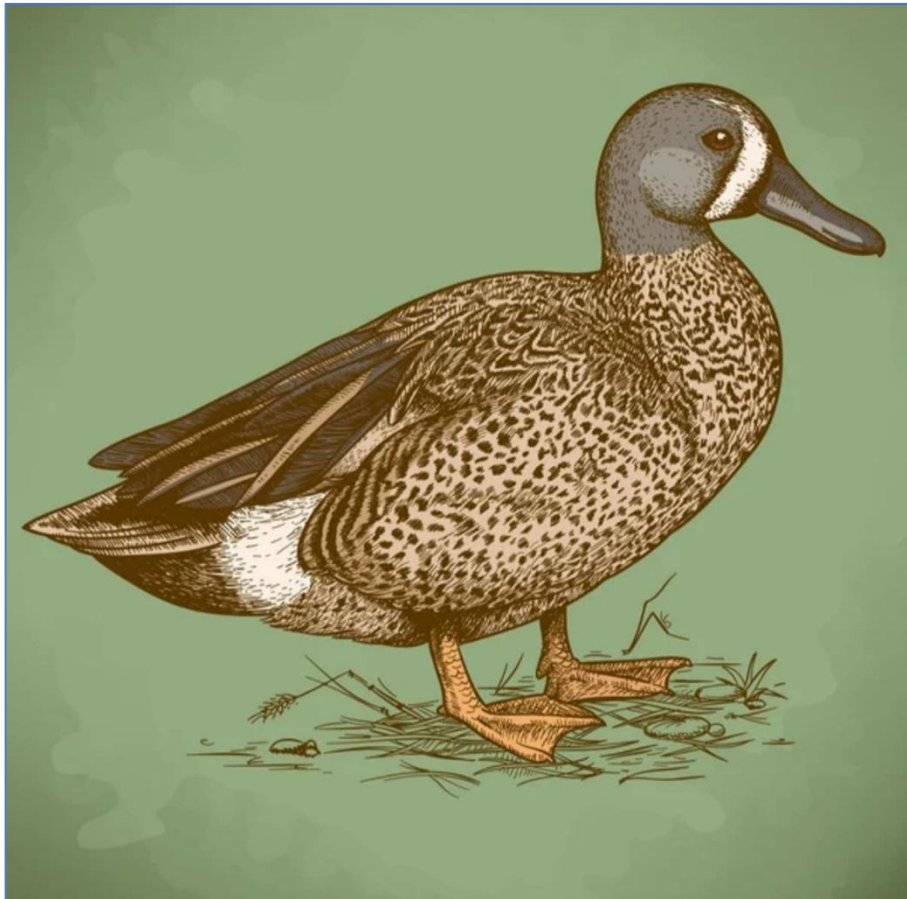
Приклад завдання з декоративної стилізації, виконаної за допомогою комп'ютерної графіки.