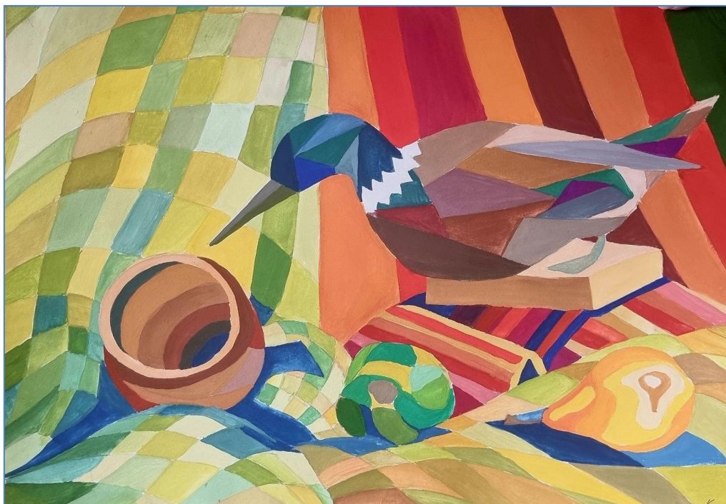
Приклад, виконаного завдання з декоративної стилізації.