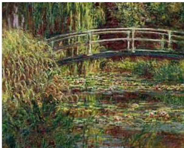
Рис. 1.1. К. Моне. «Пруд з лататтям», «Руанський полотно, олія, 1899. 1877.