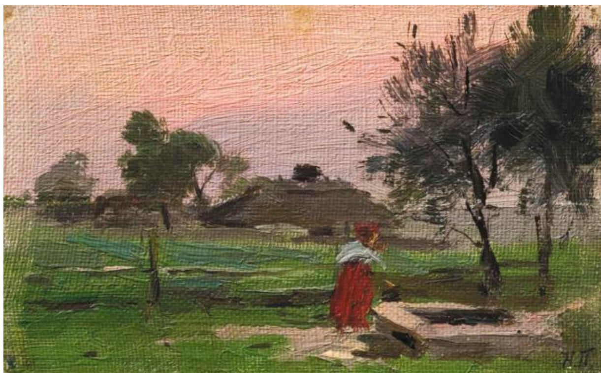
Рис. 2.2. М. Пимоненко. «Біля криниці», полотно, олія, 1908.