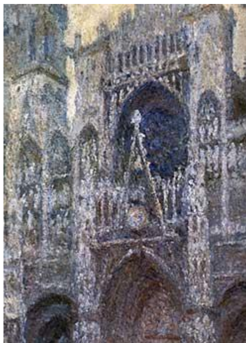
Рис. 1.2. К. Моне. «собр», полотно, олія,