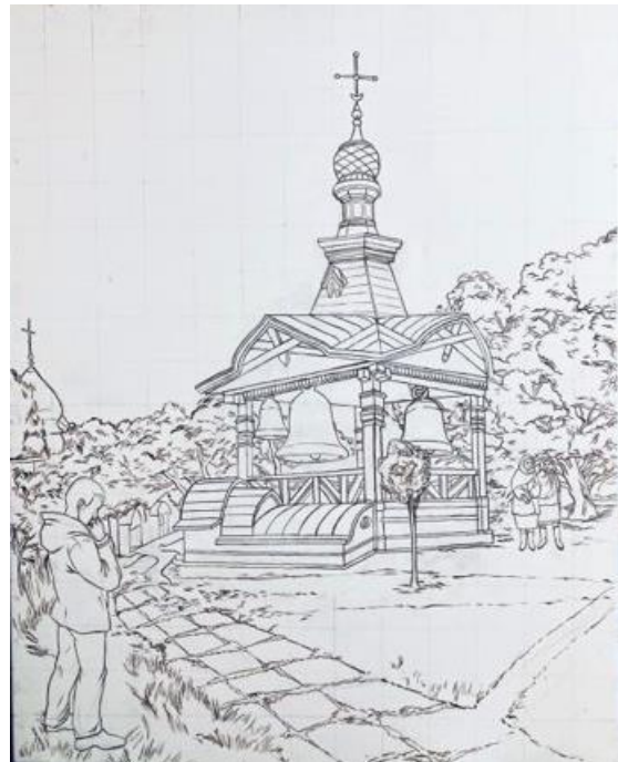
Рис. 3.1. Перший етап виконання: Рис.3.2. Другий етап виконання: пошук композиції творчої роботи конструктивна побудова творчої роботи