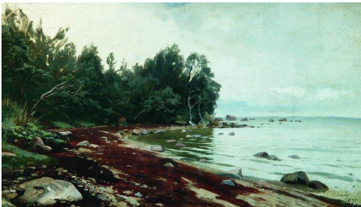
Рис. 2.1. В.Орловський. «Залив», полотно, олія, 1894.