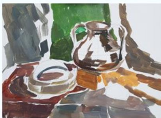
Рис.2.2. Другий етап виконання натюрморту: конструктивна побудова предметів, пошук формату, композиційного рішення