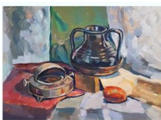
Рис. 2.4. Четвертий етап роботи над натюрмортом: узагальнення