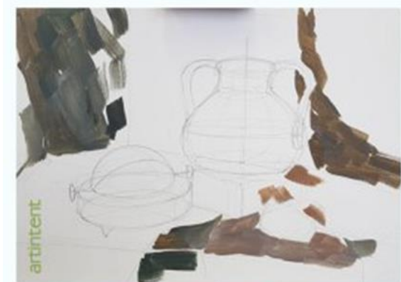
Рис. 2.1. Перший етап виконання натюрморту з побутових предметів: