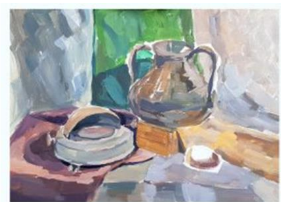
Рис. 2. 3. Третій етап виконання натюрморту: тональна проробка предметів