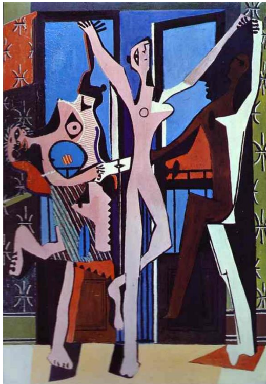
Рис. 1.1. П. Пікассо. «Три танцюра», полотно, олія, 1925.