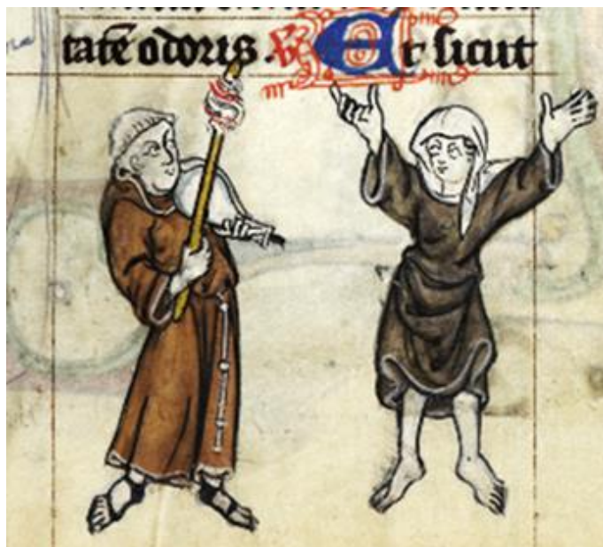
Рис. 1.2. Музикант і монахиня, що танцює. Деталь мініатюри, Маастріхський кодекс, Нідерланди (Льєж), перша чверть XIV ст.