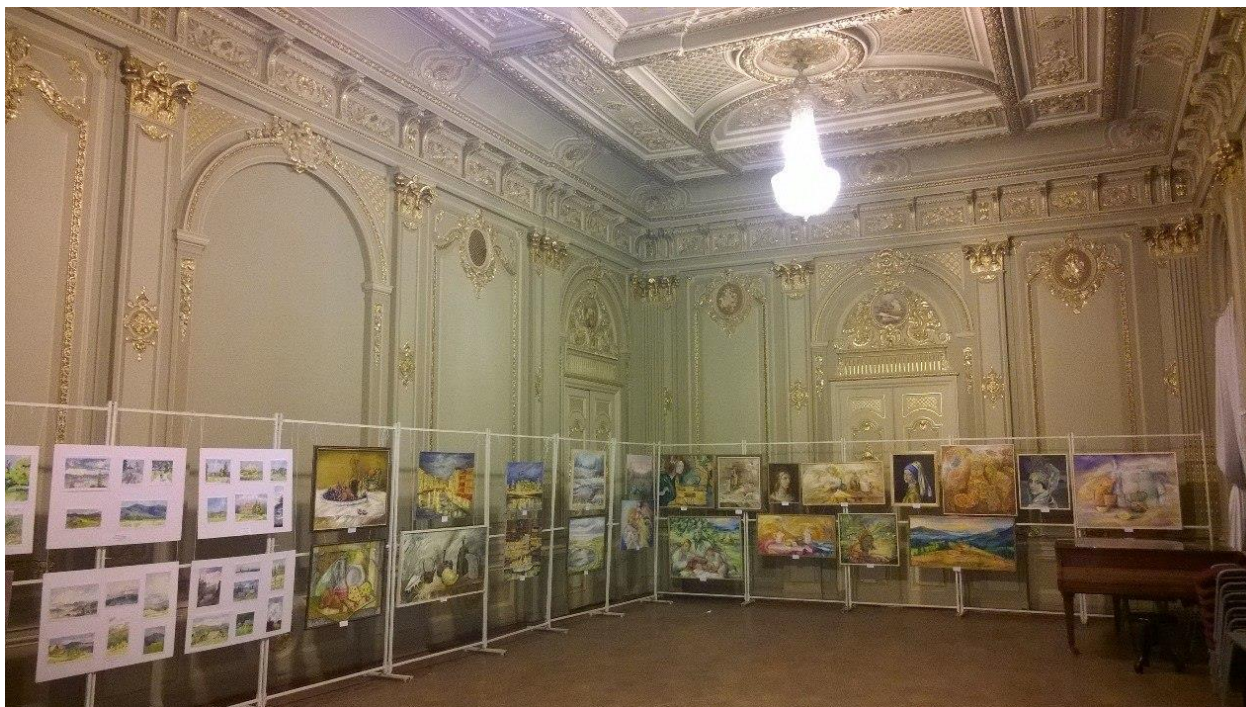
Золотий зал: роботи студентів

Експозиція вміщує і роботи студентів молодших курсів, для багатьох з яких ця виставка стала першим кроком у доросле творче життя, так і старших, демонструються навіть роботи випускників минулих років. Вітаємо митців з відкриттям і зичимо творчої наснаги на майбутнє – адже попереду красиві дні весняних пленерів!